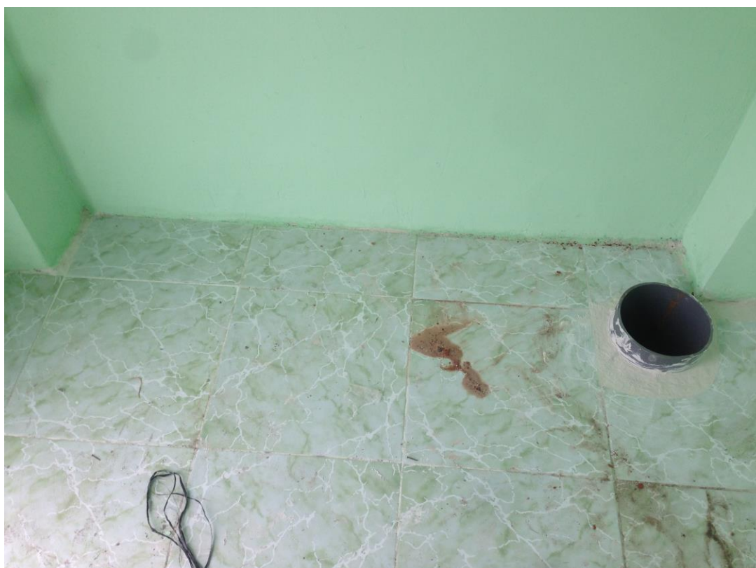
Hình sàn bên trong nhà trạm